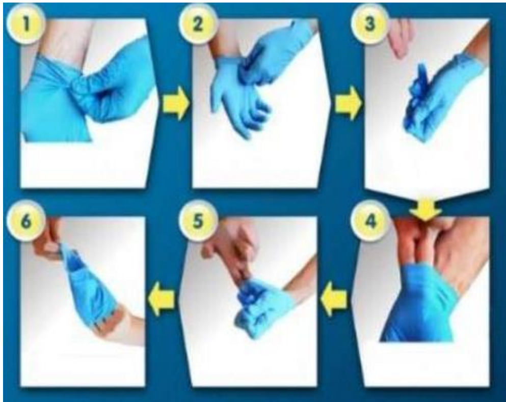
Правилно скидање рукавица

– Одложити „пакет“ коришћених рукавица правилно тј. у посебну кесу за отпад