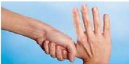
5.) zatvorenim dlanom o palac