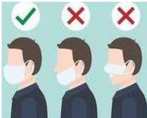
Правилна употреба заштитне маске