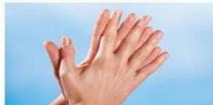
3.) dlan o dlan raširenih prstiju