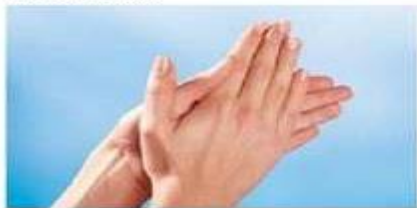
1.) dlan o dlan