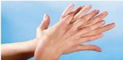
2.) dlan o nadlanicu