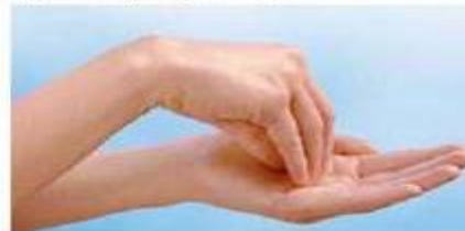
6.) vrhovi prstiju o dlan