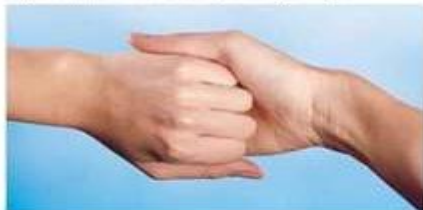
4.) šaka o šaku savijenih prstiju